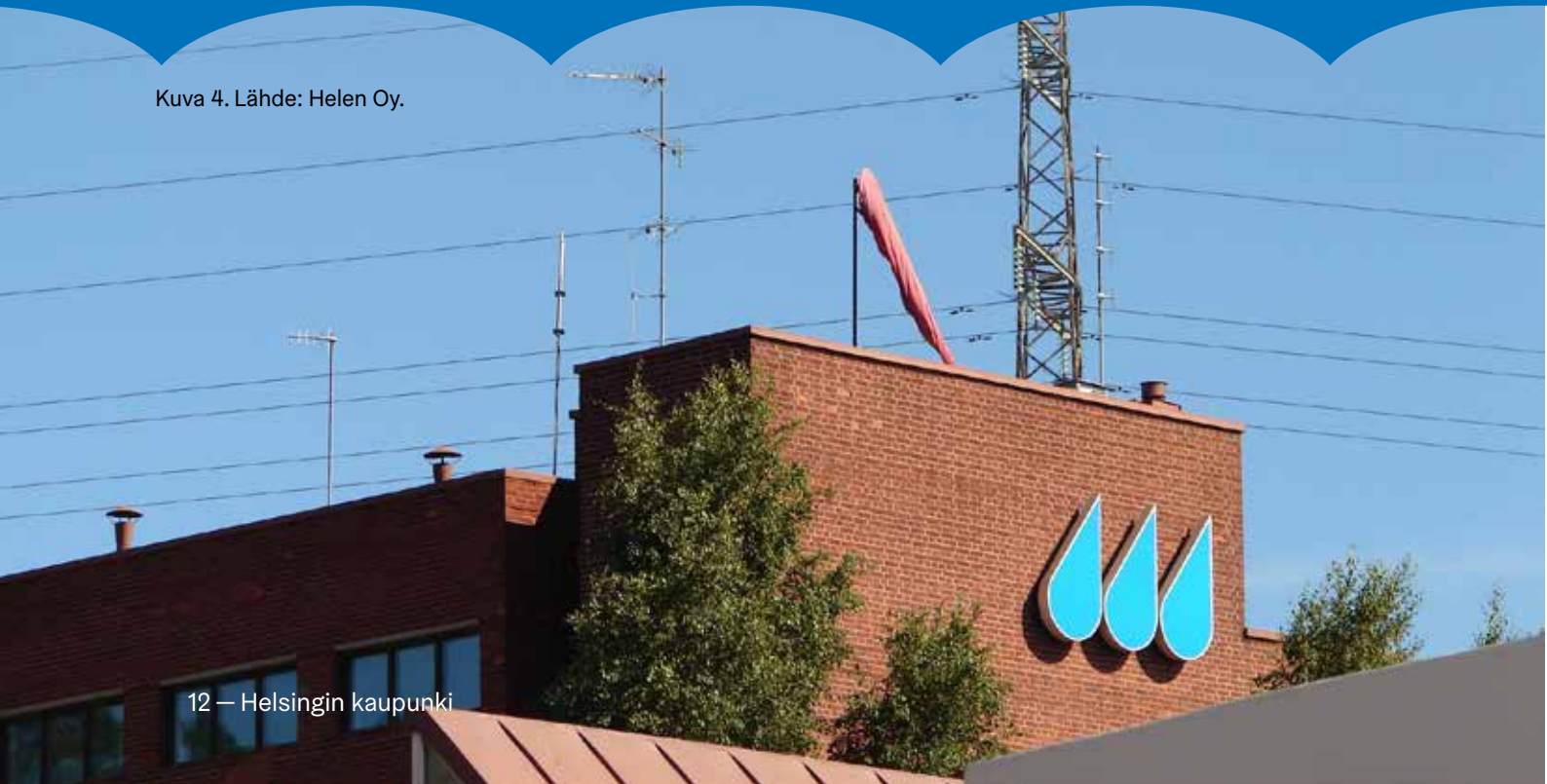
Kuva 4.

Yhteinen toiminta ja tiedonkulku eivät kuitenkaan tapahdu itsestään, vaan vaatii toimintatapojen suunnittelua ja harjoittelua. Osakeyhtiömuotoiset yritykset eivät ole automaattisesti varautumisvelvollisia, joten omistavien kuntien on ohjauksella varmistettava, että varautuminen toteutuu.