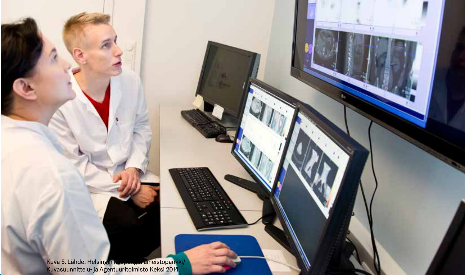
Kuva 5.

Vihamielinen toimija voi yhdistää kyberkeinoihin fyysisen vaikutuksen. Kyberoperaatiolla voidaan muokata potilastietoja eli niin sanotusti puuttua tietojen eheyteen. Eheydellä tarkoitetaan kyberturvallisuudessa sitä, että tieto on vain niiden muokkaamaa, joilla siihen pitäisi olla mahdollisuus. Mikäli kyberoperaatiota ei havaittaisi, tietojen eheyteen luotettaisiin ja sen mukaisesti toimittaisiin. Tästä voisi olla konkreettisesti tuntevia fyysisiä seurauksia: kyberhyökkääjä voisi päästä vaikuttamaan ihmisten terveyteen siten, että lääkärit tekisivät väärä hoitopäätöksiä väärin potilastietojen takia.